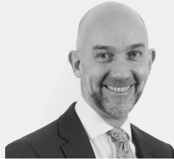
Adrian Crompton Archwilydd Cyffredinol Cymru

Rwy'n sylweddoli ei bod yn her ceisio gwario cymaint â phosibl o gronfeydd yr UE sy'n weddill. Mae cwblhau'r rhaglenni yn brin yn golygu colli arian i Gymru ond byddai eu cwblhau yn y cyfeiriad arall yn gallu golygu bil sylweddol i Lywodraeth Cymru. Er gwaethaf amgylchiadau anodd, mae'n galonogol gweld bod WEFO a Llywodraeth Cymru wedi ymrwymo holl gyllid yr UE a bod y rhaglenni ar drywydd cadarnhaol o ran gwariant. Mae angen cynnal y cynnydd hwnnw gan hefyd reoli risgiau sylweddol a sicrhau gwerth am arian.